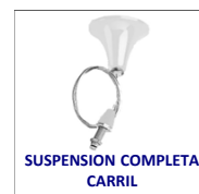
SUSPENSION COMPLETA CARRIL