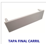
TAPA FINAL CARRIL