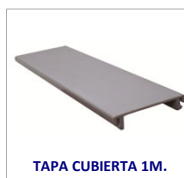
TAPA CUBIERTA 1M.